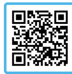
丹波篠山市議会アカウント YouTubeチャンネル

議会は基本的に年4回開催されます。開催時期は、6月、9月、12月、3月で、それぞれのタイミングで予算や条例、その他の議案について話し合いをします。丹波篠山市は「通年議会」を採用しているため、基本的にはいつでも議会を開催できます。また、YouTubeで議会の様子がライブ配信&アーカイブされているので、議会がどんな感じなのかを見ていただけます。「丹波篠山市議会」で検索してみてください。